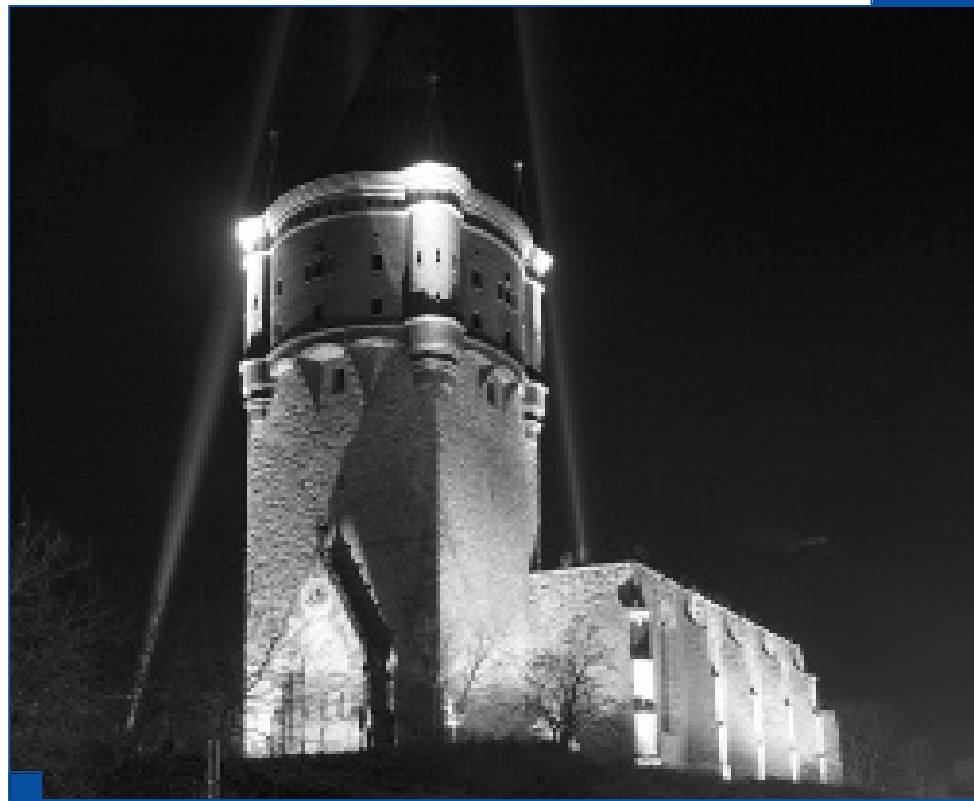
MerLicht: Am 9. Dezember ließ ein Projekt der Hochschule die Sixti-Kirchruine in Merseburg in einem anderen Licht erscheinen. Mehr dazu auf Seite 8.

Filmclub Merseburg e.V.: Einmal wöchentlich im Hörsaal 9 ins Kino gehen: Damit könnte es schon bald vorbei sein, denn dem Filmclub Merseburg und seinem Campuskino gehen die Akteure aus. Die vorerst letzte Vorstellung sollte am 13. Dezember stattfinden. Angekündigt wurde „Darwins Alptraum“. Damit würde die Geschichte einer sehr langjährigen kulturellen Bereicherung zu Ende gehen, denn der Filmclub existiert bereits seit etwa 40 Jahren auf dem Campus in Merseburg. Zu sehen war hier bislang alles, was das Zelluloid zu bieten hat. Seite 10