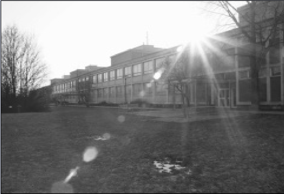
Ausweichquartier Gebäude 132: Noch stehen sie leer, die renovierten und mit notwendiger Infrastruktur versehenen Räume, aber schon in den nächsten Tagen zieht hier Leben ein.

Mit Beginn dieses Kalenderjahres beginnen nun auch auf dem Campus der Hochschule Merseburg (FH) die umfangreichen Sanierungsarbeiten. Der Bauablaufplan mit Baubeginn und Bauende sowie die Architekturpläne wurden im Intranet veröffentlicht. So kann sich jedes Mitglied der Hochschule darüber informieren, wann „sein“ Gebäude saniert wird.